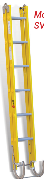
Modelo plegable SVET12PASALT.