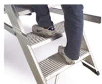
Peldaños de 20 cm de profundidad

CATM12 está homologada solamente para uso interno y CATM14 no está homologada según la normativa EN131