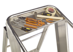
Bandeja portaherramientas para un trabajo más cómodo