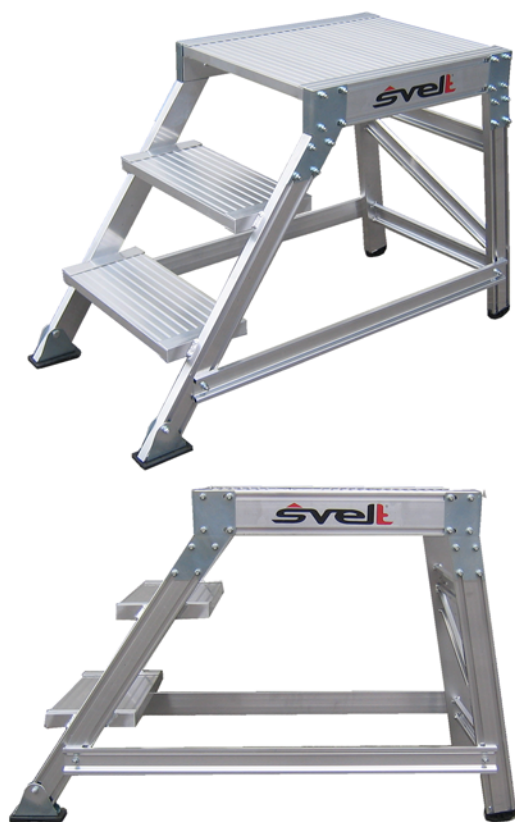
Cargo Plus de 3 peldaños