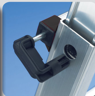
Ganchos en acero revestido con nylon