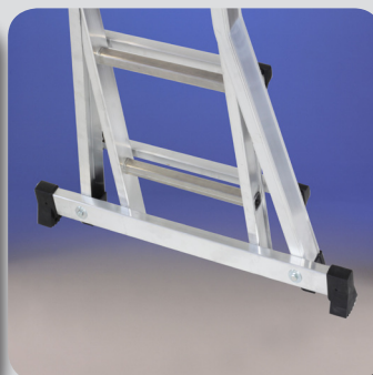
Alargador de base estándar (1 m.)