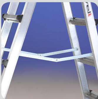
Asta de seguridad anti apertura