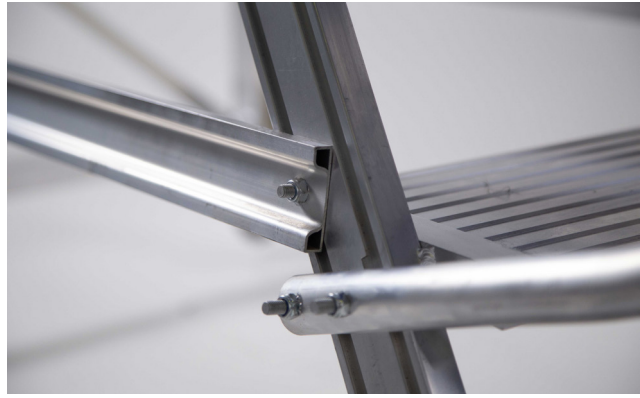
Tirantes y barandillas