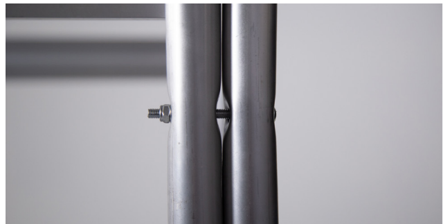
Grapas de conexión de barandillas