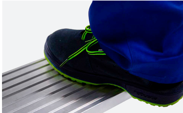
PELDAÑOS ANTIDESLIZANTES de 20 cm de profundidad