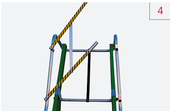
Apertura de GUARDACUERPOS