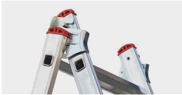
HERRAJES de acero