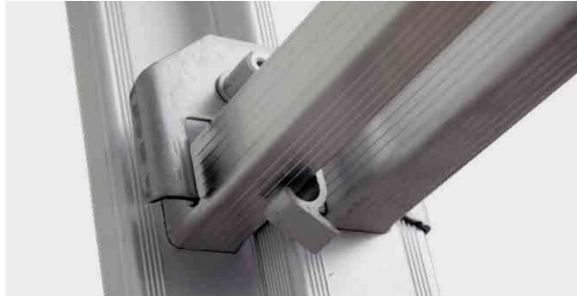
DISPOSITIVO DE SEGURIDAD ANTIDESLIZAMIENTO