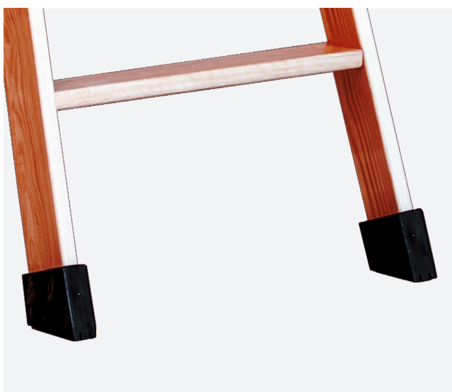
TACOS ANTIDESLIZANTES de PVC