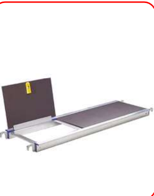
Plataforma con trampilla para acceso por el interior