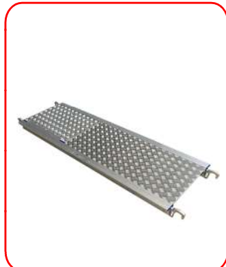
OPCIONAL: Plataforma de aluminio