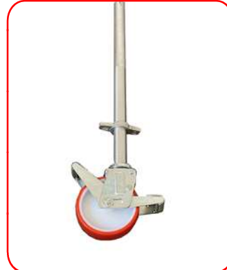
Husillos niveladores para salvar desniveles