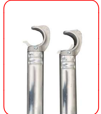
Ganchos de apertura rápidos para montaje y desmontaje sin herramientas