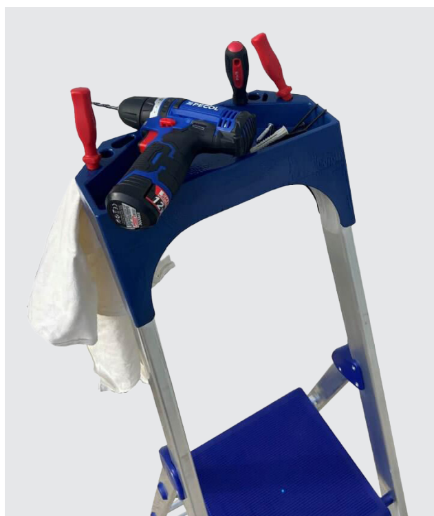
BANDEJA portaherramientas y portaobjetos

CASA PLUS es una escalera doméstica de aluminio diseñada para ofrecer comodidad y eficiencia, equipada con una plataforma de trabajo y una práctica bandeja portaherramientas. Su estructura es resistente y segura, cumpliendo con la normativa europea EN131 para garantizar un uso confiable en tareas del hogar.