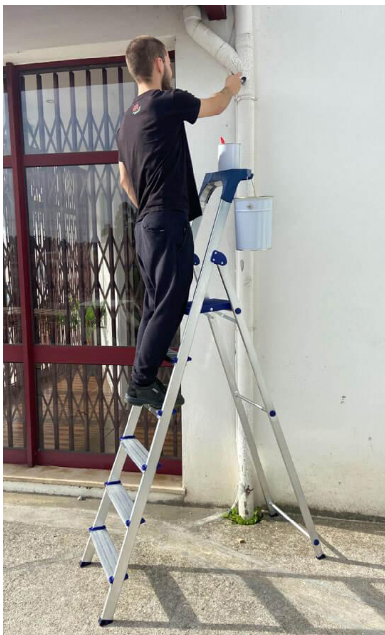
Casa Plus aplicada al trabajo.