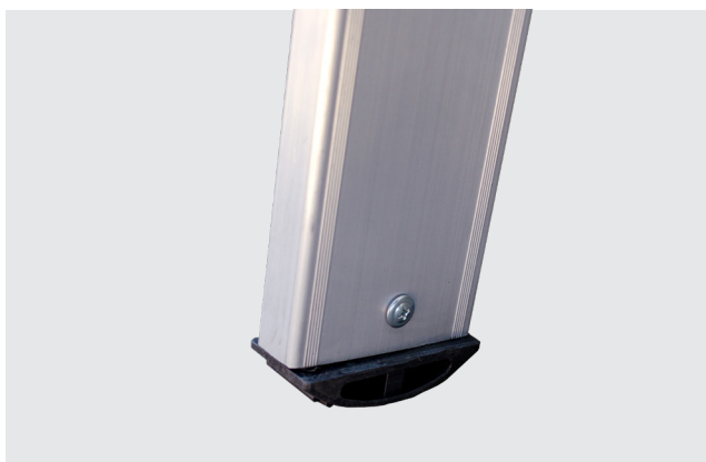
TACOS DE PVC ergonómicos antideslizantes