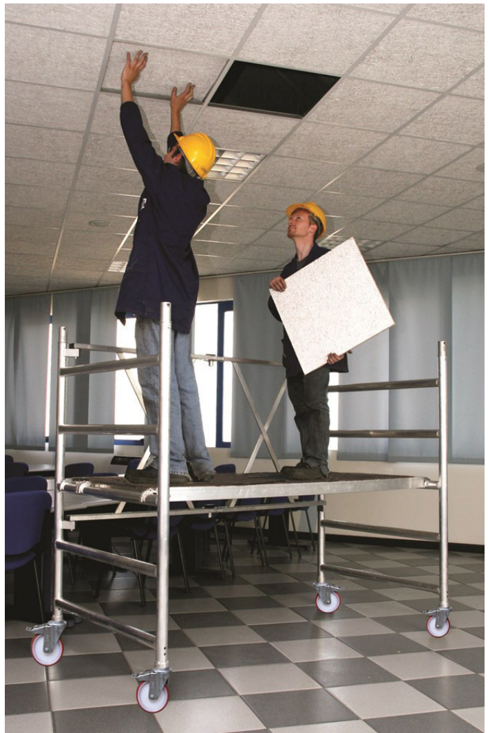
Roller Plus L 1,70 m con estabilizadores pequeños. (MÓDULO A + S1). Roller Plus APLICADA AL TRABAJO.