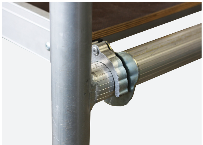
SISTEMA DE ANCLAJE