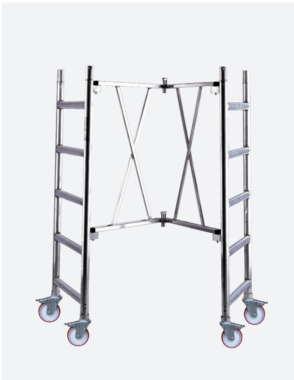
BASE PLEGABLE de apertura rápida. Cerrada pasa a través de puertas.