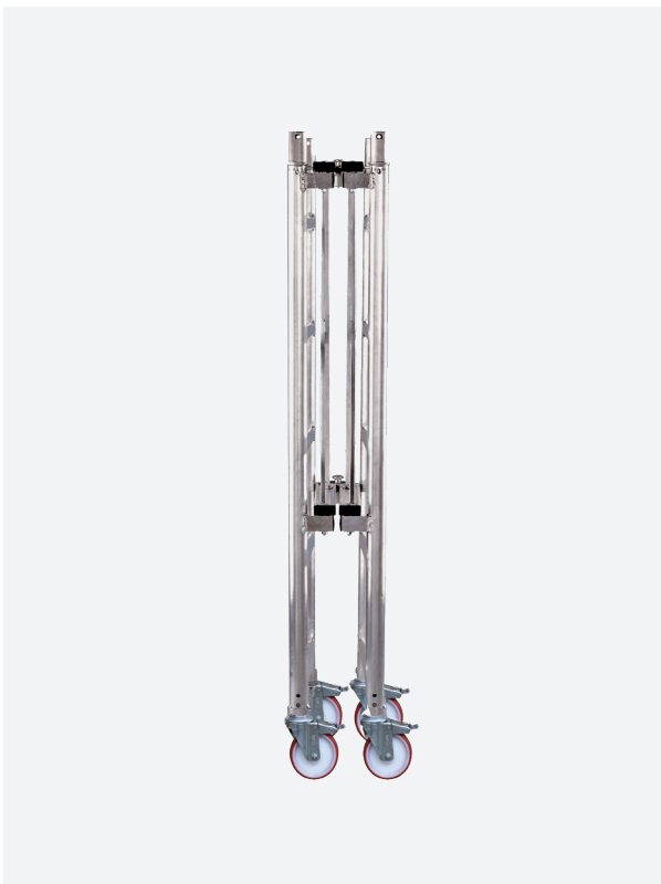
BASE PLEGABLE de apertura rápida. Cerrada pasa a través de puertas.