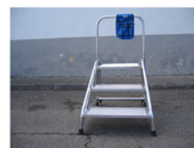
Cargo Space con barandilla frontal OPCIONAL y Svelt Bag