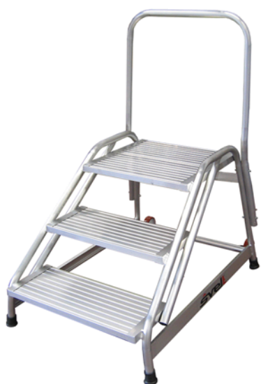
Cargo Space de 3 peldaños