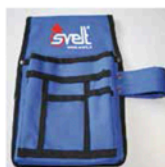
Svelt Bag portaherramientas INCLUIDA DE SERIE. Se puede atar a la cintura o colgar de la barandilla