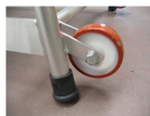
Detalle de las ruedas OPCIONALES y los tacos antideslizantes de goma