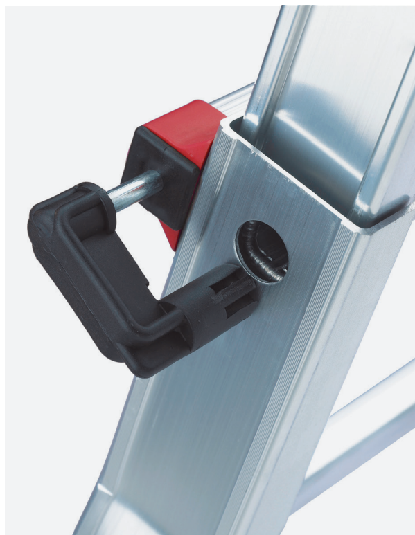
GANCHOS DE ACERO de posicionamiento rápido

INCLUYE ESTABILIZADOR. SEGÚN LA NUEVA NORMA EN 131, la base estabilizadora es obligatoria para escaleras de más de 3 m de altura en apoyo, incluida en el precio.