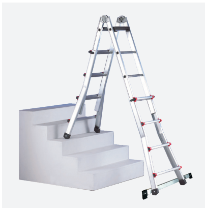
Escalísima en POSICIÓN DE DESNIVEL