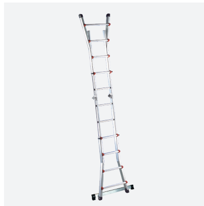
Escalísima en POSICIÓN EXTENDIDA