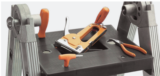
BANDEJA PORTAHERRAMIENTAS de nylon (31 x 36 cm.)

ESCALISIMA es una escalera telescópica multiposiciones de aluminio, fabricada con un sistema de ensamblaje automático. Con bisagras de posicionamiento rápido, permite su uso en posición de tijera, apoyo a pared, y se adapta a distintos niveles. Fácil de almacenar y transportar, sus versiones de 6 peldaños cumplen la norma EN131, certificada por TÜV Rheinland, y los modelos de 7 y 8 peldaños incluyen una base estabilizadora obligatoria para alturas superiores a 3 metros.