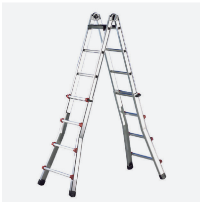
Escalísima en POSICION DE TIJERA