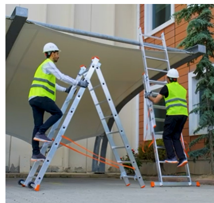
Transformable. Uso en tijera y en apoyo.

NO utilizar la escalera en apoyo con las ruedas colocadas