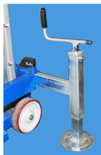
Estabilizadores extraíbles equipados con pernos niveladores