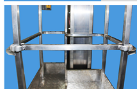
Acceso a la plataforma con barra de acceso móvil