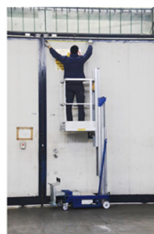
Ideal para el mantenimiento de muros y canalones