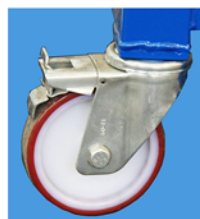
Ruedas pivotantes equipadas con freno. Diámetro de las ruedas Ø 200 mm