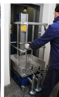
Pasa a través de puertas y cabe en ascensores