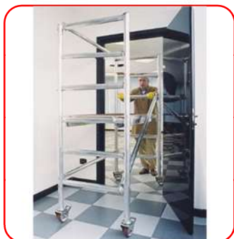
Pasa a través de puertas

Nuevo accesorio obligatorio según EN1004.1.2 para montaje/ de barandillas desde el nivel inferior. Después de montar las barandillas, el operario puede subir a la plataforma superior con total seguridad. Peso: 3,5 kg (Se necesitan 2 piezas por andamio) REF: TSERVOTECH