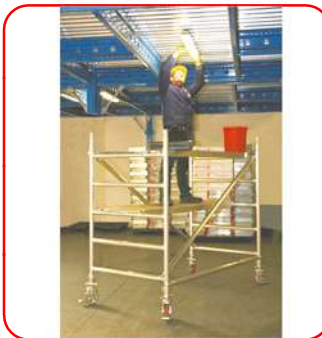
Módulo A: 1,81 m