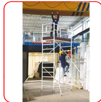
Jolly 5,37 (Módulos A+B+C+S)