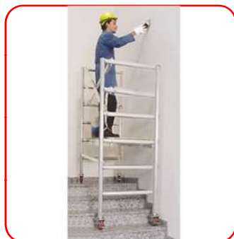
Puede trabajar en desnivel