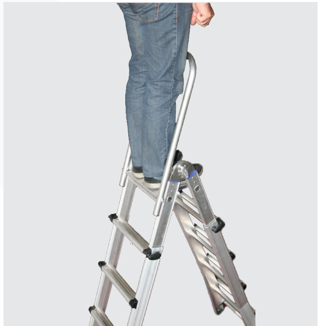
OPCIONAL: PLATAFORMA Y GUARDACUERPOS