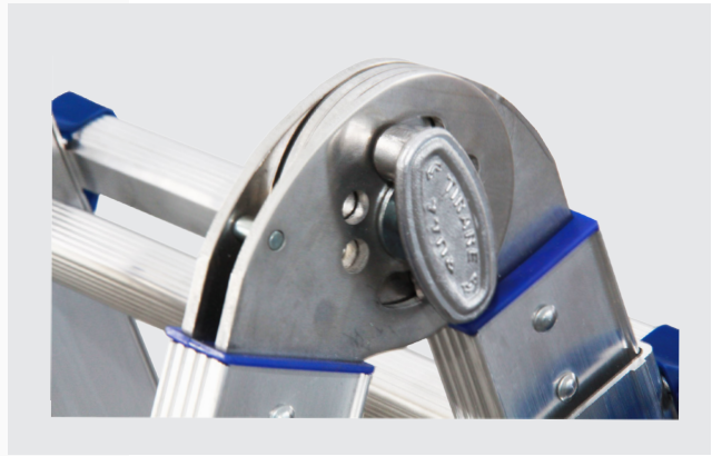
BISAGRA EN ALUMINIO