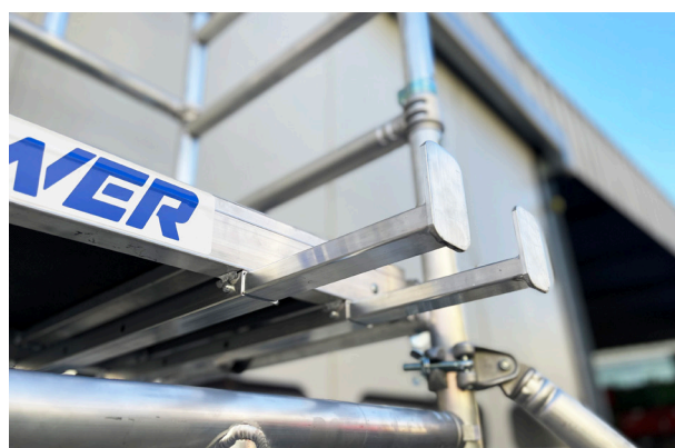
GANCHOS EXTRAÍBLES para un montaje rápido por una sola persona. Detalle ganchos bajo plataforma.