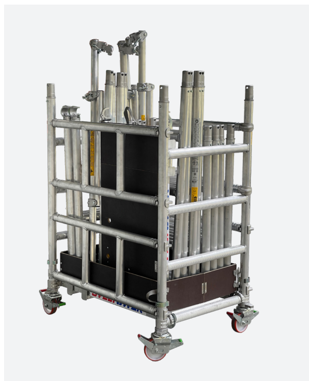
Se transporta en un MISMO CARRO