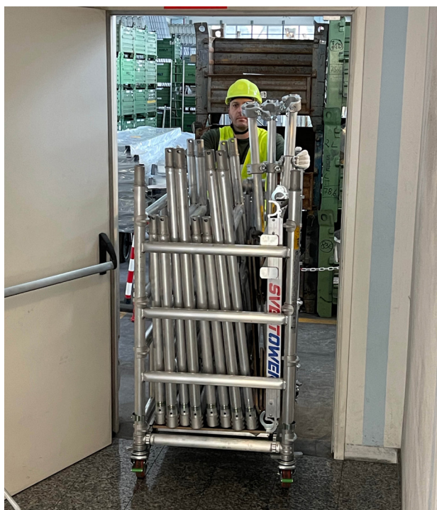
MUY COMPACTO Y VERSÁTIL. Cabe en vehículos comerciales, ascensores...