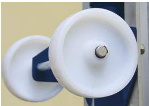
OPCIONAL: RUEDAS EN COLUMNA para cargar en furgonetas.