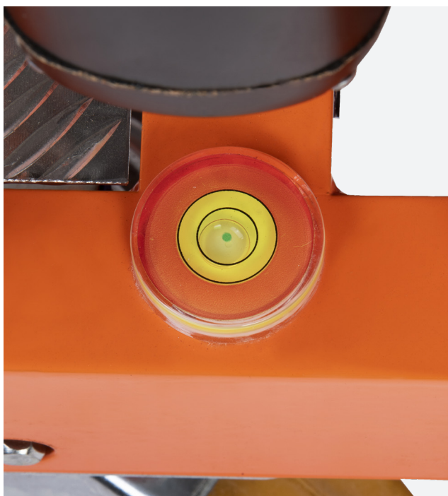
NIVEL DE BURBUJA incorporado