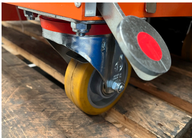
OPCIONAL: RUEDAS HD con freno de pedal.