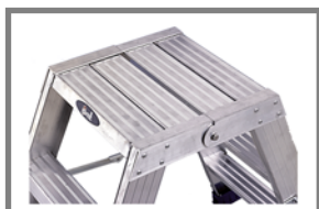
Plataforma de 35 x 39 cm