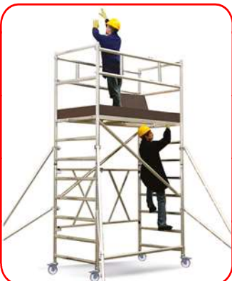
Roller Plus L 3,46 (Módulos A+B5+S)