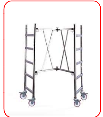
Base de apertura rápida 1,70 m