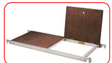
Plataforma con trampilla