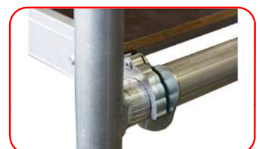
Ganchos antiviento en la plataforma