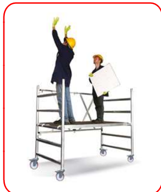
Roller Plus L 1,70 m (Módulo A)