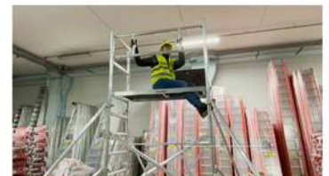
Sistema de montaje a través de la trampilla