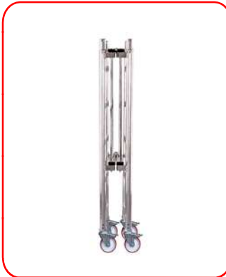
La base cerrada pasa a través de puertas