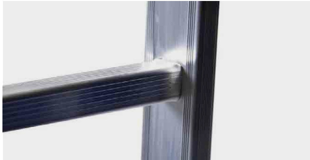
Detalle de la escalera