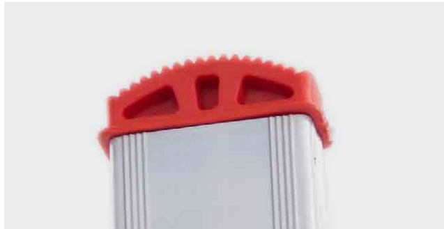
TACO del perfil