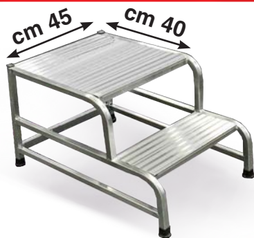
Cargo 2 gradini con piattaforma maggiorata