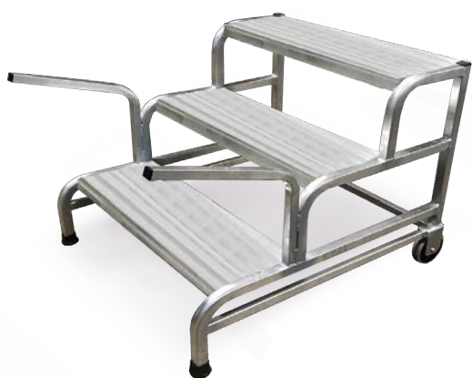
Cargo 3 gr. Kit 2 ruote frontali + maniglie di sollevamento