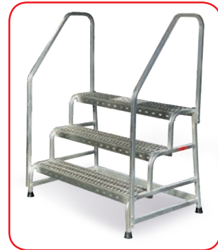
Gradini in alluminio grigliato (optional): supergrip e drenanti per olio, cemento e neve