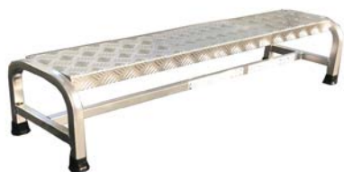
Cargo con misure speciali (RICHIEDERE PREVENTIVO)

Sgabello professionale a gradini ad un tronco di salita. In alluminio interamente saldato, forma un monolito ultra-resistente ideale per utilizzo su macchinari in officina e per l'accesso a piani di carico. Gli ampi gradini piani antidrucciolo in estruso nervato sono saldati ad una robusta struttura tubolare (mm 25x25). La base è svasata con un appoggio a terra estremamente ampio (cm 50) che gli conferisce grande stabilità e comfort di utilizzo. È inattaccabile dalla ruggine.