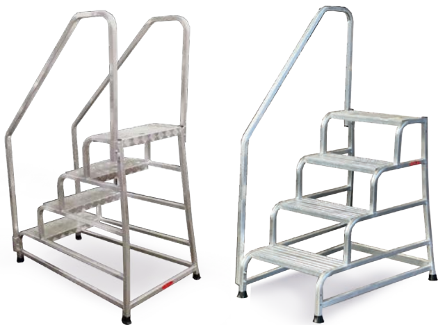
Cargo con corrimani laterali: doppio (sbarco frontale) o singolo