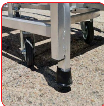
Sistema attivato (sgabello libero)