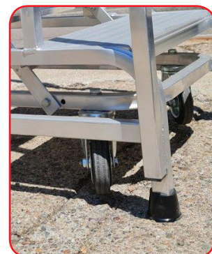
Sistema disattivato (sgabello bloccato)