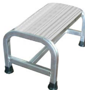
Cargo da 1 gradino