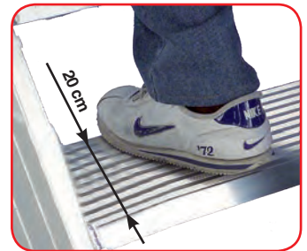
GIORNO MAXI profondità gradino cm 20