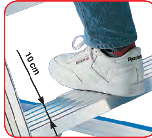
GIORNO profondità gradino cm 10

Scale semplici d'appoggio a gradini saldati ai montanti, ad un tronco di salita. In alluminio nervato estruso, permettono di accedere comodamente a sopalchi, muri, sottotetti, solai, ecc. Giorno Maxi è a salita comoda con inclinazione rampa a 55°.