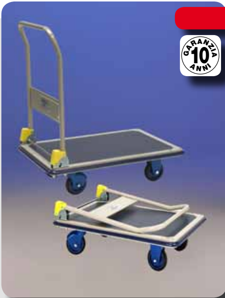
Carprestar300 portata 300 Kg

PRESTAR è la più grande azienda mondiale di Super Carrelli professionali in acciaio portatutto con manico richiudibile. Sono dotati di ruote made in Italy anti-impronta e silenziose con cuscinetti a sfera di alta qualità che consentono una spinta senza resistenza e fatica. ( freno automatico a richiesta ).