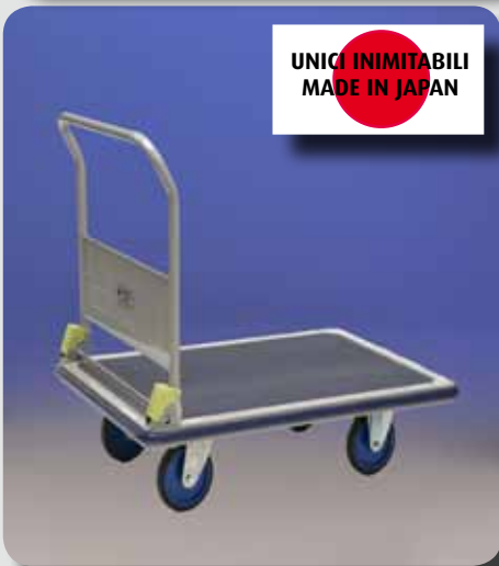
Carprestar500 portata 500 Kg