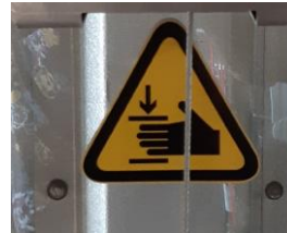
Piastra di protezione in plexiglass trasparente

Pedana a fondo piatto ideale per scatole e casse. Pedana fissa a terra: 285x240 mm, 6mm di spessore. Piattaforma di sollevamento: 450x300 mm, 6mm di spessore Portata 100 kg. Operatore protetto da una lastra in plexiglass trasparente per proteggere le mani e altre parti del corpo. Altezza di sollevamento: da 12 a 882 mm Sistema di sollevamento: Verricello con maniglia. Struttura in tubo ovale in alluminio per una migliore presa. Più stabilità grazie a un passo extra largo. Grandi slitte in plastica per superare senza danni scale e soglie realizzate in LLDPE (polietilene lineare a bassa densità) molto resistente. Maniglie di sicurezza ovali ergonomiche in gomma con protezione nocche. Dotato di pneumatici antiforatura e anti impronta