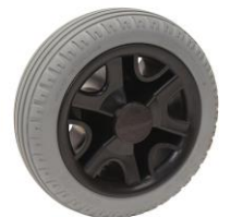
Gomme antiforatura e anti impronta