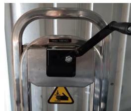
Verricello con maniglia