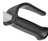
Maniglia di sicurezza ergonomica