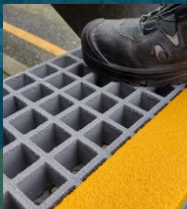
GRADINI IN VETRORESINA