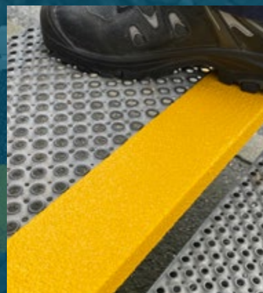
COPERTURA DEGLI SPIGOLI