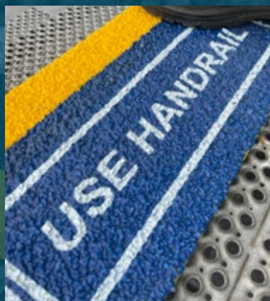
COPERTURA GRADINO CON TESTO