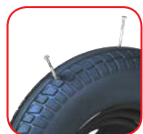
Ruote piene antiforatura Ø 260 mm

Carrello professionale in alluminio per trasporto estintori, bombole, ed oggetti simili. Prodotto in robusto estruso di alluminio, compatto e facilmente trasportabile è progettato appositamente per addetti alla manutenzione degli estintori; consente infatti di trasportare fino a 7 estintori (11 col kit orizzontale). Dotato di vano multifunzione su cui appoggiare gli estintori durante la manutenzione. Un solo prodotto ergonomico e progettato per tutte le fasi della manutenzione degli estintori, dal trasporto al riempimento.