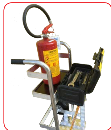
Kit Portacassetta estraibile in dotazione

Consente di appoggiare la cassetta tenendo il pianetto libero per l'appoggio dell'estintore