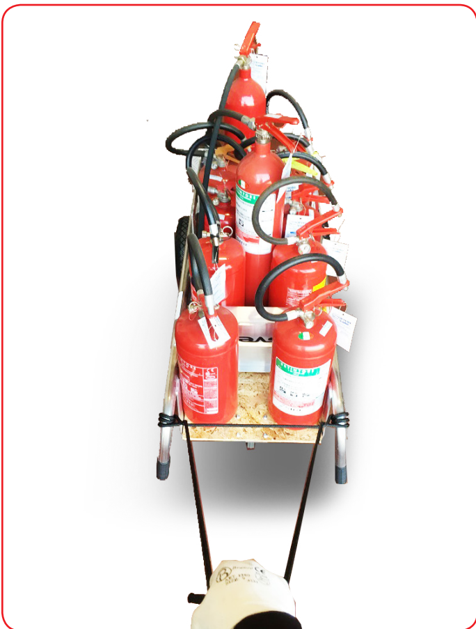
Kit Posizione Orizzontale