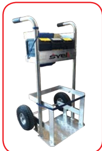
Telaio in alluminio rinforzato con saldature a TIG certificate