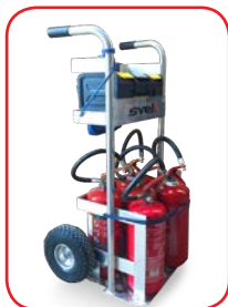
Con 5 estintori da 6 Kg