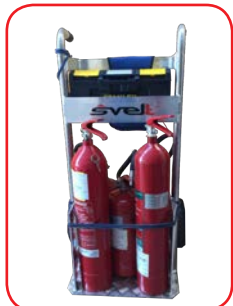
Con estintori misti bassi ed alti CO2 e POLVERE