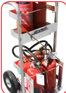
Sistema di fissaggio a S con la cinghia elastica in dotazione