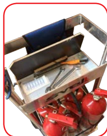
Vano multifunzione con cancelleria

• Kit portacassetta estraibile: Consente di inserire la cassetta portatrezzi lasciando libero il vano porta estintore per una manutenzione più comoda (vedi foto)