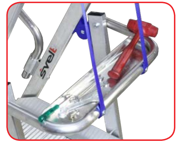
Pianetto portattrezzi chiudibile portata Kg 15