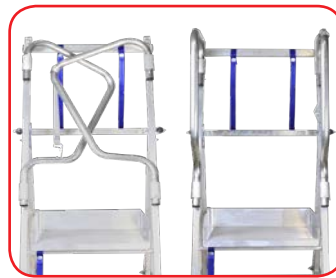
Corrimani con chiusura brevettata