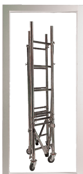
Modulo base chiuso per il passaggio attraverso porte e corridoi

NORMATIVE E COLLAUDI: Italia è costruito in conformità al D.LGS81/2008 per l'utilizzo nei luoghi di lavoro. Il trabattello è stato sottoposto a test interni fra i quali test di portata e di ribaltamento, documentati e certificati per poterne dichiarare la conformità al D.Lgs.81/2008 come indicato dalla guida tecnica INAIL del 2022. La portata di Kg 150 è stata collaudata positivamente. Leggere il manuale per tutte le indicazioni di sicurezza.