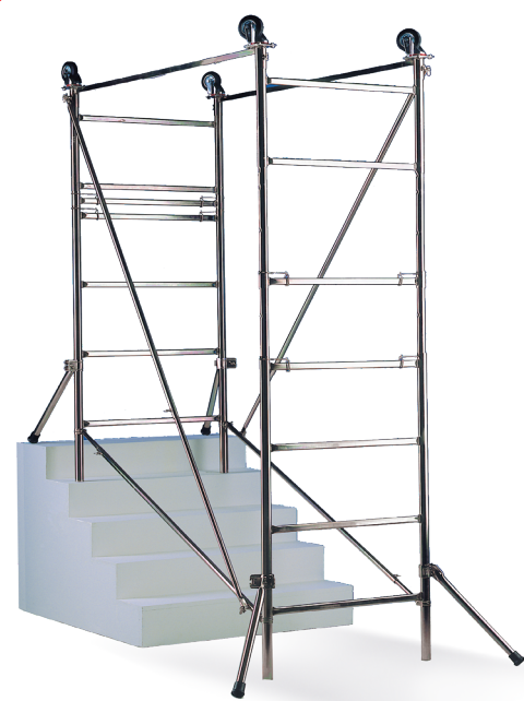
Modulo base in posizione zoppa per lavori su rampe di scale