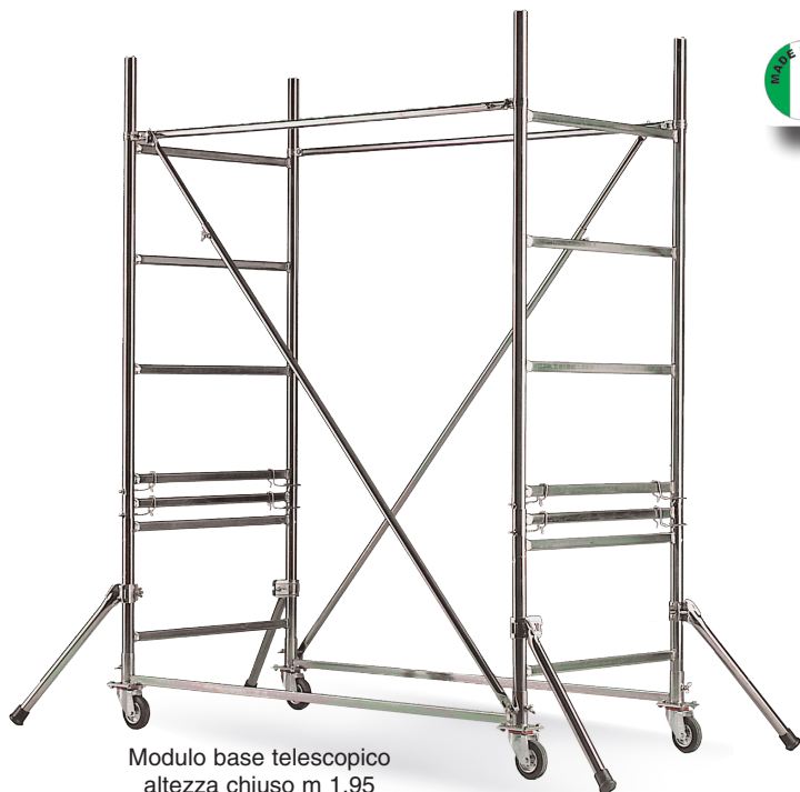
Modulo base telescopico altezza chiuso m 1,95 altezza sfilato m 2,80