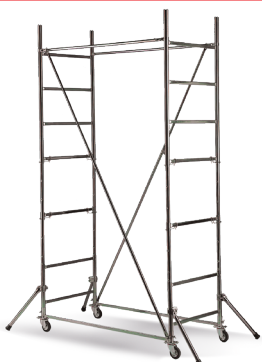
Modulo base sfilato mediante il sistema telescopico a m 2,80