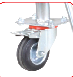
In dotazione 4 ruote Ø 100 con freno