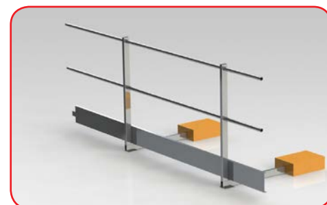
PC3A (zavorrato in appoggio)