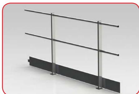
PC1A (fissaggio a pavimento)