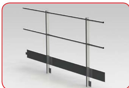
PC2A (fissaggio a parete)