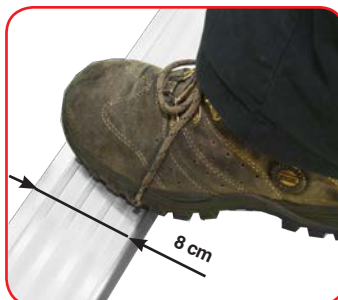
Gradino largo antisdrucciolo cm 8