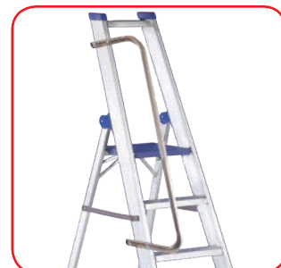
Corrimano a richiesta