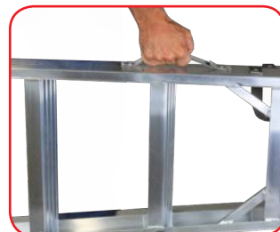
Maniglia di trasporto