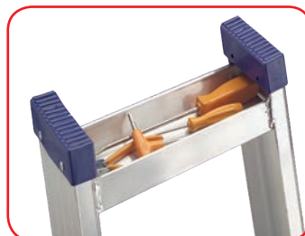
Vaschetta portattrezzi cm 26x7x3