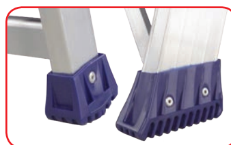
Piedini ergonomici maggiorati antisdrucciolo rivettati