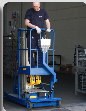
Passa da porte standard