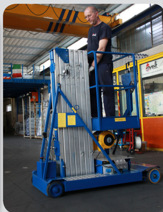
Comodo accesso da terra