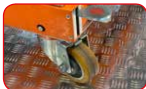
Ruote Ø mm 150