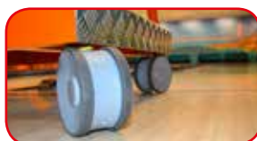
Ruote Ø mm 125